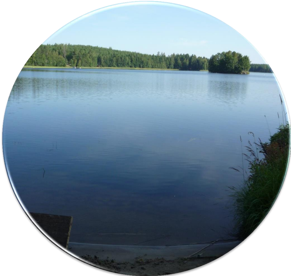
Kuva: Päijänteen Eetunpohjaa 9/2014 K.V